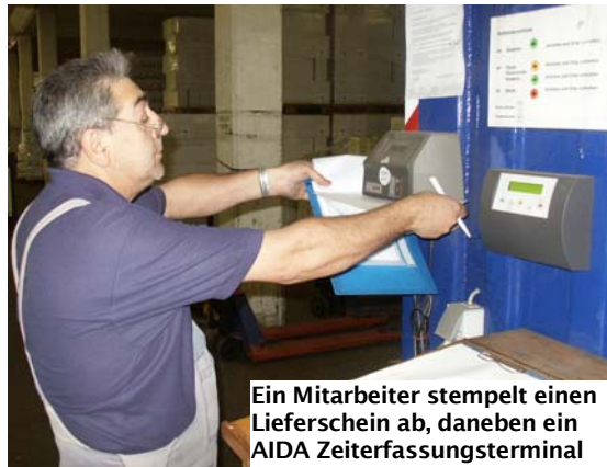
Ein Mitarbeiter stempelt einen Lieferschein ab, daneben ein AIDA Zeiterfassungsterminal

Ebenso wie die produktiven Arbeiten werden auch alle Gemeinkosten erfasst. Bei Spedition Bernards wird mit Ausweisen gearbeitet, von denen jeder einer Kostenstelle zugeordnet ist. So auch die nichtproduktiven Personalkosten sofort sichtbar.