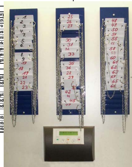
Erfassungsplatz mit Ausweisen für jede K-Stelle, der Plan befindet sich in Reichweite