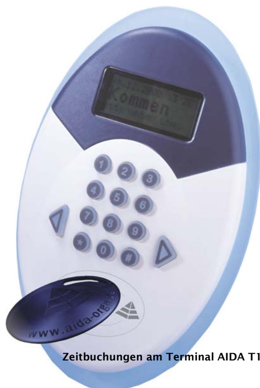
Zeitbuchungen am Terminal AIDA T100